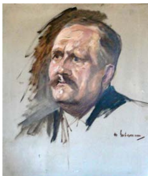
D. Friedrich Naumann, (Schriftsteller) Deutsche Demokratische Partei (DDP) [Seite 1654 C] [...]

Deshalb bedauern wir also das Steckenbleiben der reinlichen Trennungsarbeit im Ausschuß und wahrscheinlich auch im Plenum.“ [...]